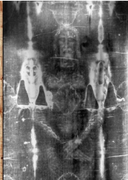
Foto av linklede i Torino. Viser fram neste gang i 2035, men Suda- riet, hodeklede nærmest Jesu ansikt vises fram